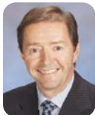
PRÉSIDENT Michel Lanteigne *